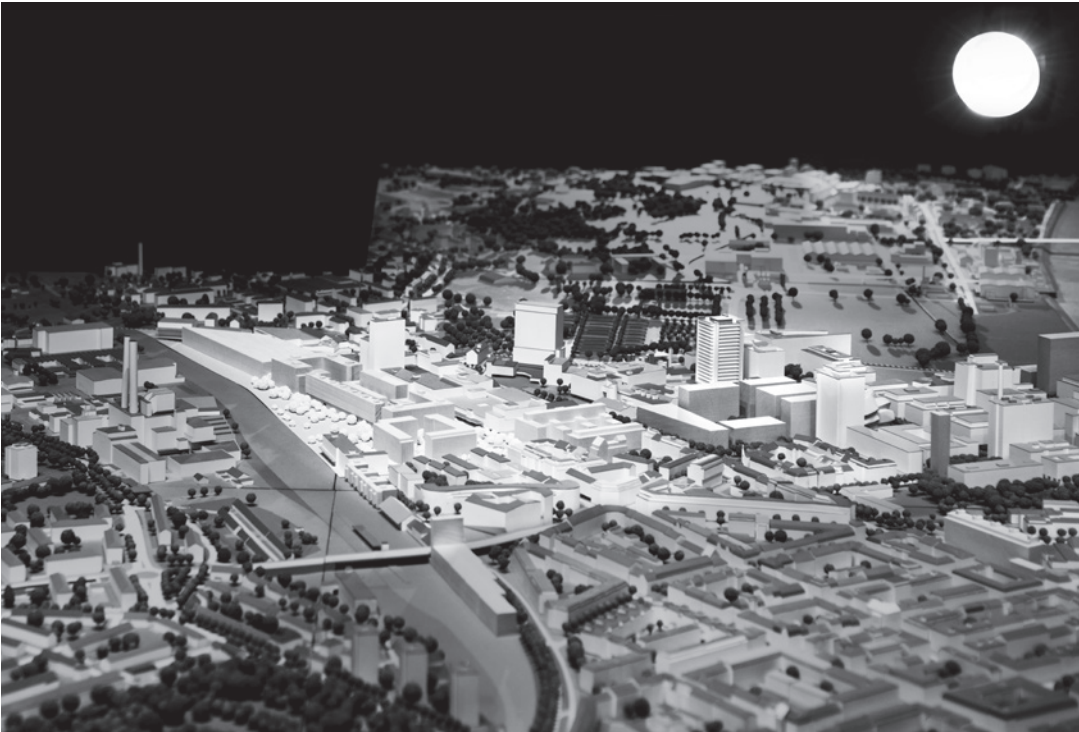
Novartis Campus, Lysbüchel Areal